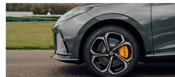
Boucliers avec finition Piano Black