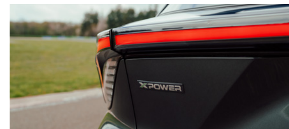
Badge extérieur, badge intérieur et seuils de portes XPOWER