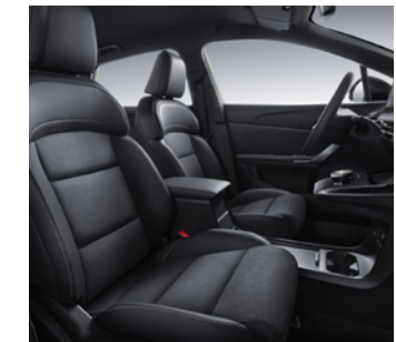
Sellerie en similicuir/Alcantara®