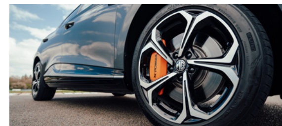
Jantes alliage 18" bi-ton et étriers de freins orange avec logo XPOWER

MG4 Electric XPOWER - 64 kWh 320 kW / 435 ch 4WD 40 490 € (1)