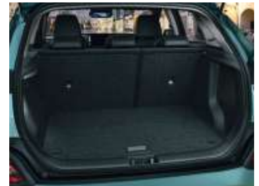
Coffre de 332 à 1114 litres (VDA)

Toit contrasté Chalk White indisponible en France.