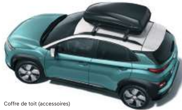
Coffre de toit (accessoires)

KONA electric a été conçu pour s'adapter à toutes vos activités. Outre l'espace à bord pour le conducteur et les passagers, le volume de chargement atteint 332 litres (norme VDA). Vous pouvez rabattre les dossiers de la banquette arrière en un éclair pour porter cette capacité à 1114 litres. Et si besoin, le toit peut supporter jusqu'à 80 kg : l'idéal pour un coffre de toit ou un porte-vélo (voir catalogue accessoires). Pour vos trajets du quotidien, vous trouverez divers espaces de rangement, notamment sous la console centrale : la suppression du levier de vitesses traditionnel a permis de dégager un large espace pour vos effets personnels.