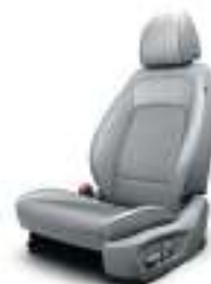
Cuir gris clair