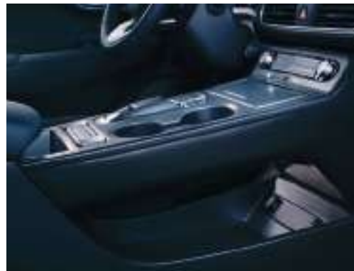
Console centrale flottante