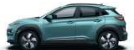
Ceramic Blue (de série)